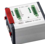
N 1704 I/O