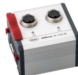
N 1702 M