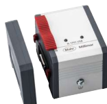
N 1701 USB