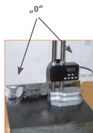
1. Nullstellung - "0"-Setting