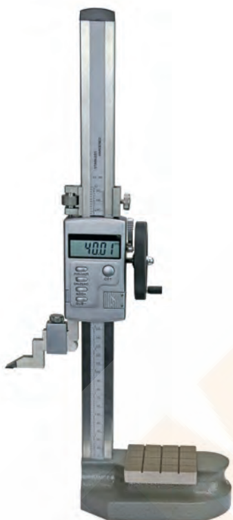
Tisch 80 x 80 x 10 mm aus Stahl/ table 80 x 80 x 10 mm steel