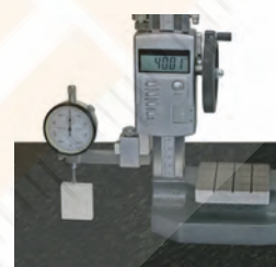
Anwendungsbeispiel / sample