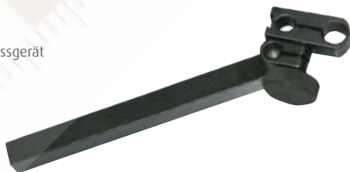
Anwendungsbeispiel / sample