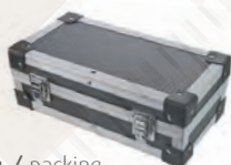
Verpackung / packing 06071040, 06071042, 06071044