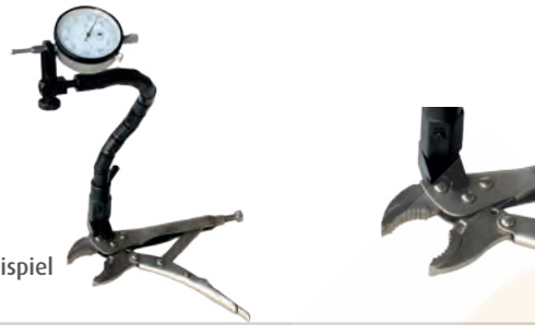
Anwendungsbeispiel / sample