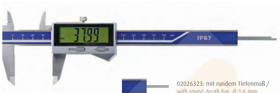
02026323: mit rundem Tiefenmaß / with round depth bar Ø 1,6 mm