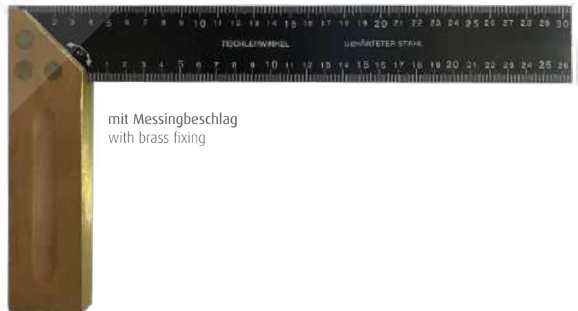
mit Messingbeschlag with brass fixing