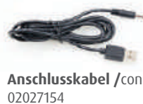
Anschlusskabel /connection cable 02027154