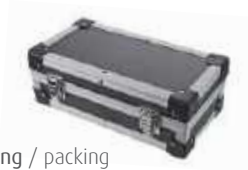
Verpackung / packing 06071040, 06071042, 06071044