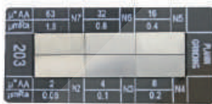
08082030 Planschleifen/ plain grinding