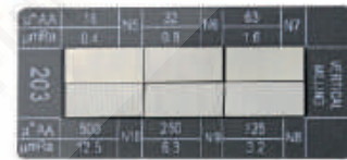
08082032 Vertikalfräsen/ vertical milling