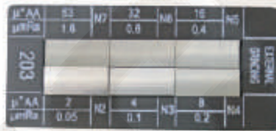
08082034 Rundschleifen/external grinding