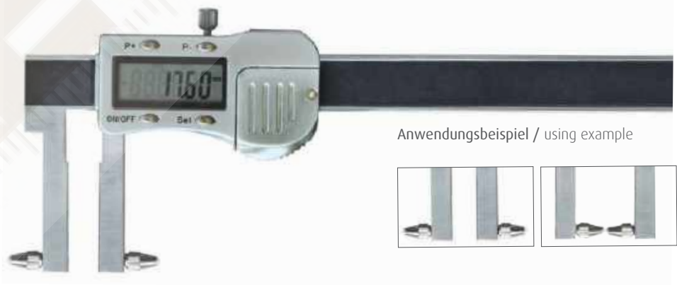
Anwendungsbeispiel / using example