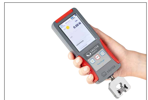
Compact force gauge with internal measuring cell (up to max. 500 N) for fast and mobile force measurements. Illustration shows optional accessories, SAUTER AE 500 screw tension clamp