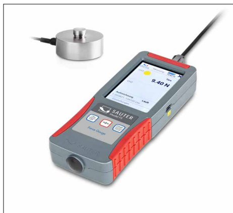
SAUTER FS RQ1