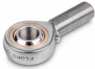
Fig. shows optional accessories SAUTER CE R20, for further accessories please visit our online shop