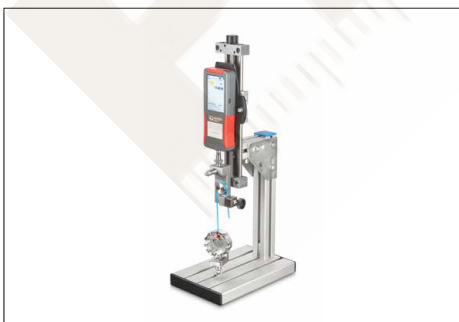
Can be mounted on all SAUTER test stands, illustration shows optional accessories, as well as the SAUTER TVL-XS manual test stand

The SAUTER FS premium force gauge is compatible with all SAUTER strain gauge measuring cells, see Measuring cells . Up to 4 external measuring cells can be connected simultaneously.