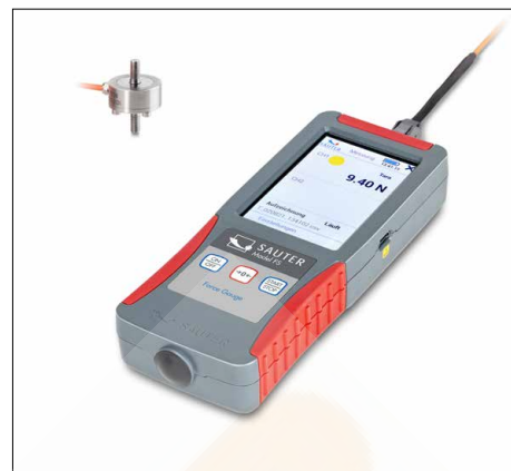
SAUTER FS OY2

For tensile and compressive force measurements