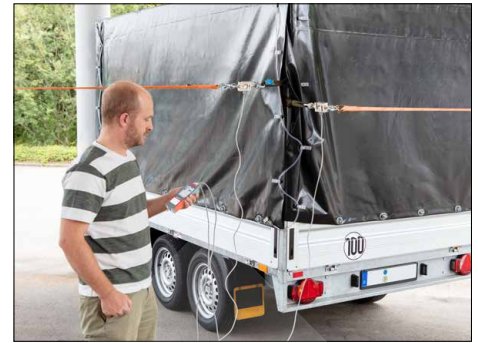
Measurement of forces in different tensile or compression directions possible with only one measuring device