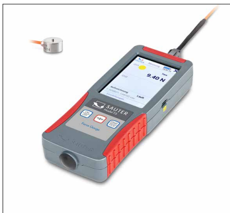
SAUTER FS OY1