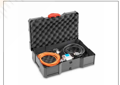
Tip: Order the practical system case (systainer® T-LOC) for storing and transporting of accessories, clamps, sensors, etc. at the same time, SAUTER FS TKZ, see Accessories