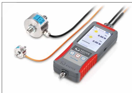
Simultaneous measurement on up to four channels. External sensors with sensor data memory, optionally available, see Measuring Cells