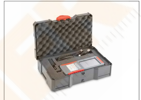
Supplied in a high-quality and robust system case (systainer® T-LOC) including plug-in power supply and USB cable type C