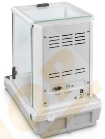
KERN ACS/ACJ with standard data interface RS-232 and USB

The bestseller in analytical balances, with high-quality single-cell weighing system, also with EC type approval [M]